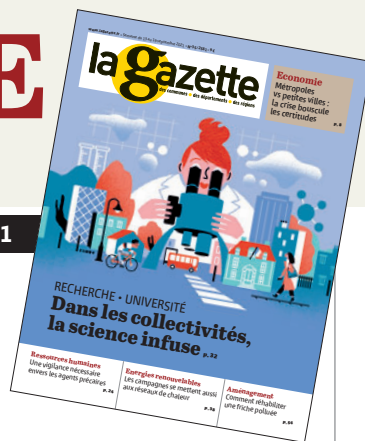
ILLUSTRATION DE COUVERTURE : CLOD