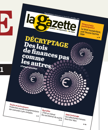
ILLUSTRATION DE COUVERTURE : P. DISTEL/LA GAZETTE.

03 Editorial. Les nouveaux sous-préfets aux champs