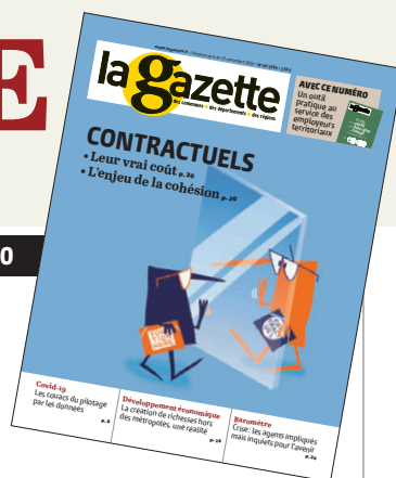
ILLUSTRATION DE COUVERTURE : COLCANOPA.

03 Editorial. Le Président, le maire et le petit commerce