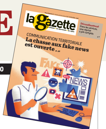
ILLUSTRATION DE COUVERTURE : CLOD