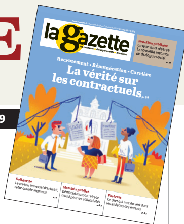
ILLUSTRATION DE COUVERTURE : CLOD.