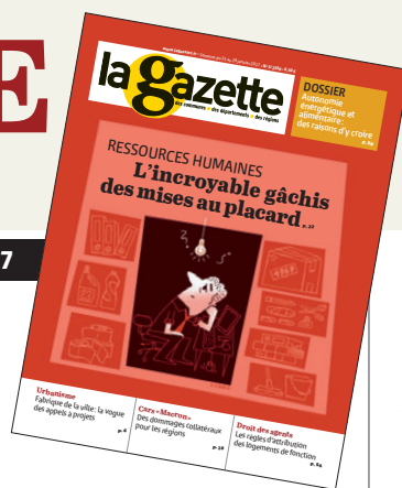
ILLUSTRATION DE COUVERTURE : CLOD