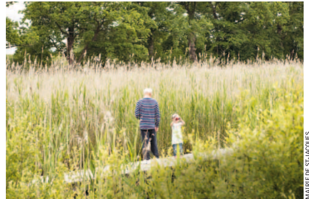
MAIRE DE SAINT-JACQUES

Le parc urbain de Saint-Jacques-de-la-Lande est devenu le nouveau centre-ville