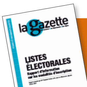
INFOGRAPHIES: ARTPRESSE.