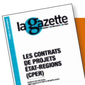
ILLUSTRATION DE COUVERTURE: CLOD. INFOGRAPHIE: ARTPRESSE.