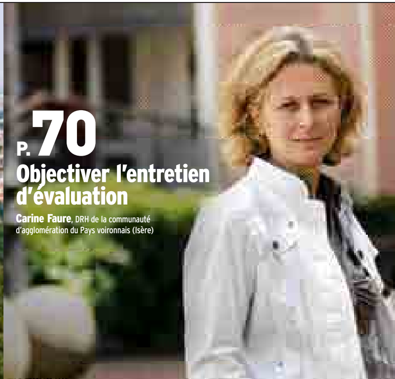
BERNT / MORILLON / THOUVERNY ARCHITECTES-ATELIER T.TERRIBLE

P. 70 Objectiver l'entretien d'évaluation