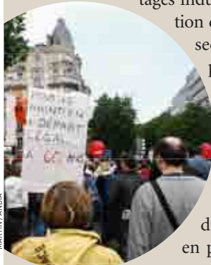
MARTIN / ANDIA

Les pensions de retraites des agents territoriaux s'inscrivent dans la moyenne française : 1 122 euros fin 2008. Elles sont loin de faire d'eux des nantis bénéficiant d'avantages indus. L'harmonisation des systèmes des secteurs public et privé a débuté en 2003, avec la loi « Fillon », qui a aligné les durées de cotisations du premier sur celles du second et mis en place décotes et surcotes. Mais face aux propositions encore floues du gouvernement concernant l'imminente réforme, les syndicats estiment que certains points ne sont pas négociables. .... p. 28 à 35